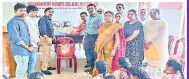
మురిపాలెం డిగ్రీ కళాశాలలో..