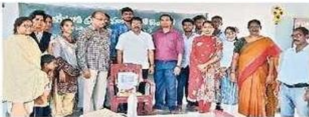
చింతూరు డిగ్రీ కళాశాలలో ప్రకాశం పంతులు చిత్రపటానికి నివాళులు లభిస్తున్న అధ్యాపకులు, సిబ్బంది