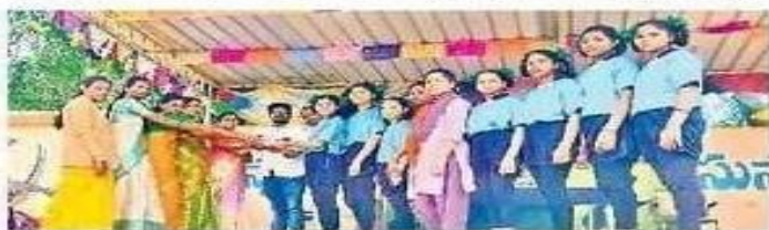
ముంచంగిపుట్టు బాలికల ఆశ్రమోన్నత పాఠశాలలో బహుమతుల ప్రదానోత్సవం