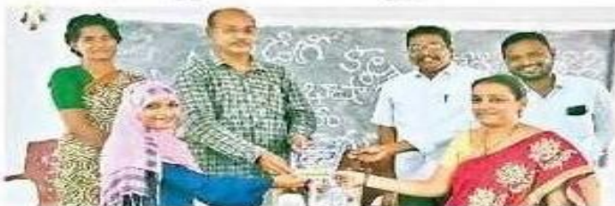
చింతూరు డిగ్రీ కళాశాలలో..

పాడేరు, చింతపల్లి గ్రామీణం, గూడెంకొత్తవిడి, న్యూనెట్టుడే: పాడేరులో విద్యార్థులకు ఆటల పోటీలు నిర్వహించారు. చింతపల్లి డిగ్రీ కళాశాలలో ప్రిన్సిపాల్ బ్రహ్మాచారి మాట్లాడుతూ విద్యార్థులు మాతృభాషపై మమకారం పెంచుకోవాలన్నారు. జర్రెల గిరిజన సంక్షేమ బాలుర ఆశ్రమోన్నత పాఠశాలలో కార్యక్రమం జరిగింది.