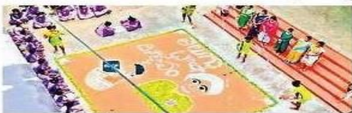
మారేడుమిల్లి విద్యార్థుల ప్రదర్శన

తెలుగు భాషా దినోత్సవాన్ని సోమవారం జిల్లావ్యాప్తంగా జరుపుకొన్నారు. గిడుగు రామ్మూర్తి చిత్రపటానికి నివాళి అర్పించారు. పక్షులు మాట్లాడుతూ తెలుగు భాష జెన్నత్యాన్ని కాపాడుకుందామని పిలుపునిచ్చారు.